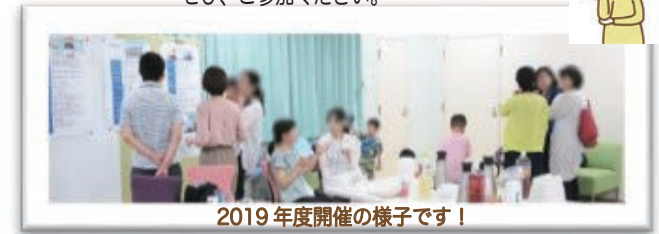
2019年度開催の様子です！

和気あいあいとした雰囲気の中で自由に情報交換していただいています。今回も昨年に引き続きオンライン開催です！ご自宅からでもお気軽にご参加いただけます。