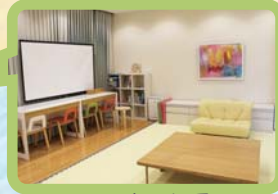
託児実施部屋 (MUSCAT CUBE 2 階 医療人支援室)